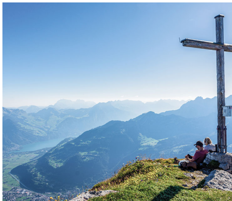
Gipfelfreuden auf dem Rautispiz.