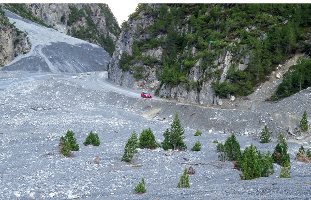
Nach jedem starken Niederschlag muss die Strasse wieder freigebaggert werden.

Alpengasthof Crusch Alba, S-charl, 081 864 14 05, www.cruschalba.ch