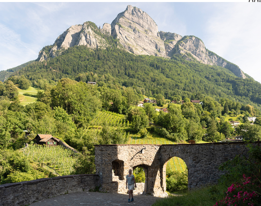
Beim Schloss Sargans hat man den Aufstieg auf den Gonzen noch vor sich.

Erreichbar ist Sargans mit dem Zug über Zürich oder Chur.