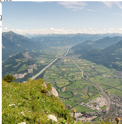
Imposante Aussicht vom Gonzen aus aufs Rheintal.