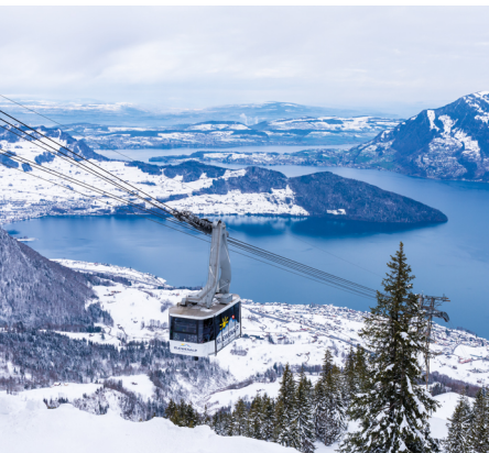
Die Luftseilbahn Beckenried-Klewenalp, tief unten der Vierwaldstättersee.

Information über den Zustand des Schneeschuhtrails und der Schlittelpiste unter: www.infosnow.ch