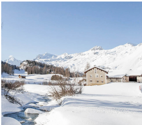
In Fex Platta zeigt die Ebene ihren vollen Charme.