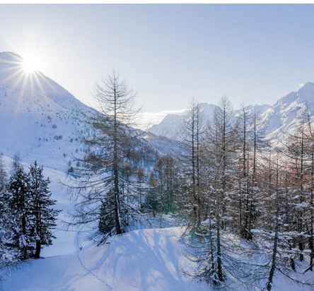
Die Aussicht auf der Plattform Güvè ist atemberaubend.

Erreichbar ist Sils/Segl Maria, Posta mit dem Bus von St.Moritz.