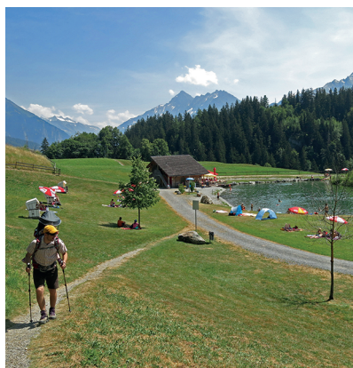
Die Rast am Badeseeli könnte länger ausfallen als geplant.