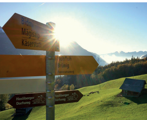
Der Panoramaweg hält sein Versprechen.

Meringues in der Bäckerei Frutal in Meiringen, 033 971 18 21, www.frutal.ch Gondelbahn Meiringen-Hasliberg Reuti, 033 550 50 50, www.meiringen-hasliberg.ch