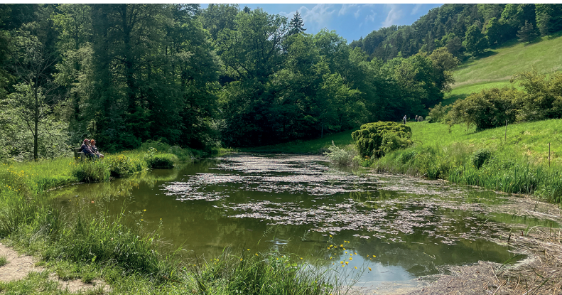
La panchina al bordo dello stagno è un luogo idilliaco per fare una sosta.

Auberge communale la Croix d'Or, Yens, 021 800 31 08, https://auberge-communale-yens.ch/