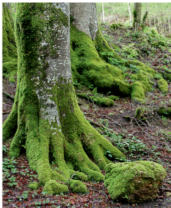
Links: kolossale Felsenfigur der Fille de mai. Rechts: Verzauberte Winkel im Jurabuchenwald.