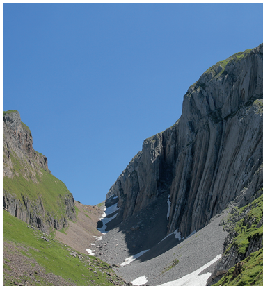
Nel Gross Mälchtal il sentiero è incastrato tra scoscese pareti rocciose.