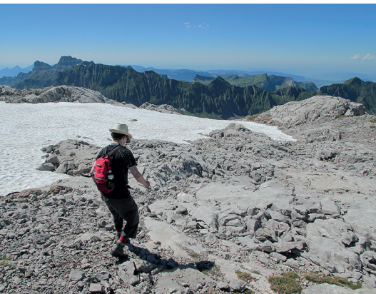
Il sentiero attraverso la roccia carsica del Silberen è accidentato. Quindi è meglio godersi il panorama durante una sosta.

È possibile fare una sosta nella trattoria Tor, 079 731 70 22 (panpepato con panna montata,