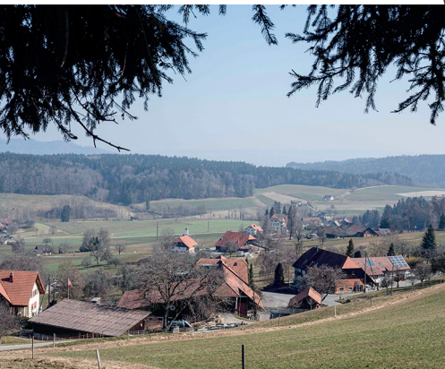
Das Dorf Schiltwald von Schweikhof aus gesehen.

Restaurant Sternen, Schmiedrued, 062 726 18 10, www.sternen-schmiedrued.ch Weberei- und Heimatmuseum Ruedertal, www.webereimuseum.ch