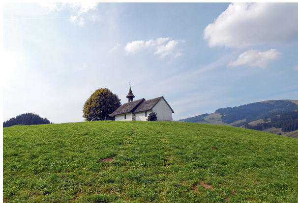
Die Guarinuskapelle auf der Pré de l'Essert ist im Besitz der Zisterziensermönche der Abtei Hauterive.