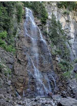
Der Wasserfall des Seeweidbachs.

Buvette Chalet Tissineva, geöffnet von Anfang Juni bis Ende August, 026 927 20 55, www.tissineva.ch/de