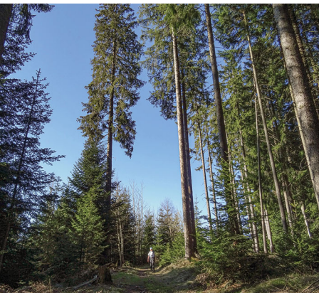
Riesige Fichten flankieren den Wanderweg auf der Schafegg.

Hotel-Gasthof Linde, 031 771 03 17, www.linde-linden.ch