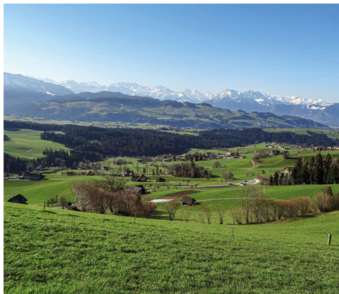
Aussicht auf die Stockhornkette kurz vor der Falkenfluh.