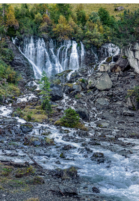
«Bi de sibe Brünne», die Quelle der Simme.

Kleine Alprestaurants auf den Alpen Ritz, Langermatte und Rezilbergli