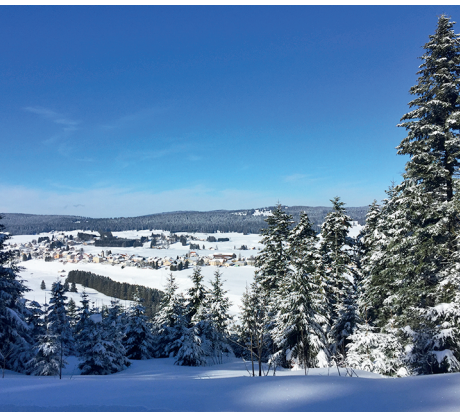
Aussicht auf L'Auberson. Dahinter die weiten Wälder des französischen Juras.

Gîte rural du Mont-des-Cerfs, 024 454 24 69 Restaurant de la Gittaz, 024 454 38 38