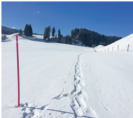
Der Weg zum Mont des Cerfs ist wenig anspruchsvoll.