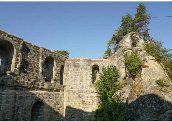
Die Überreste der Grasburg zeugen von einstiger Grösse.

Restaurant zur Schwarzwasserbrücke, 031 731 02 02, schwarzwasserbruecke.ch