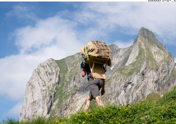
Zwischen Zwinglipasshütte und Teselalp erblickt man den Girespitz, das Toggenburger Matterhorn.

Zwinglipasshütte, 071 565 36 21, www.sac-toggenburg.ch/clubhuette zahlung nur mit Bargeld möglich