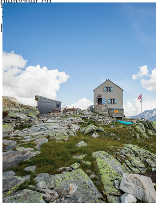
Die Dammahütte ist eine der kleinsten bewirteten SAC Hütten der Schweiz.