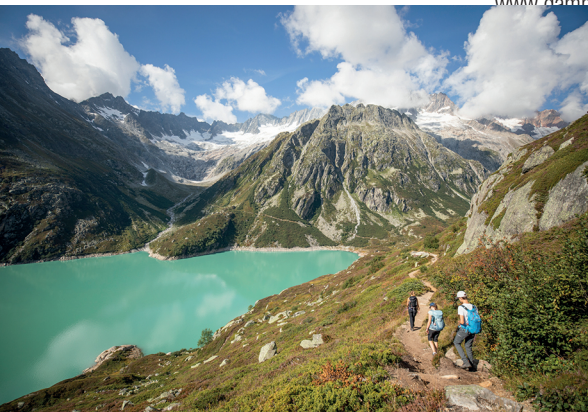
Spektakuläre Aussicht: hinter dem Göschenalpsee präsentiert sich die Dammakette.

Gasthaus Göschenalp 041 885 11 74, www.gasthaus-goeschenalp.ch Berggasthaus Dammagletscher, 041 886 88 68, www.dammagletscher.ch