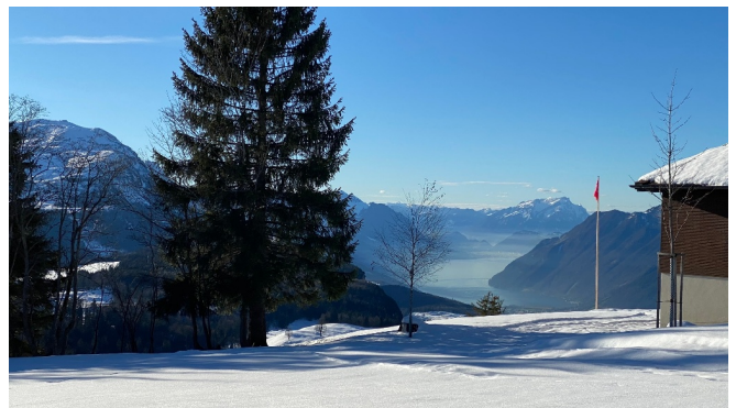
Rundweg Illgau - St. Karl