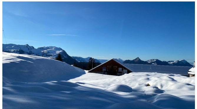
Rundweg Illgau - St. Karl