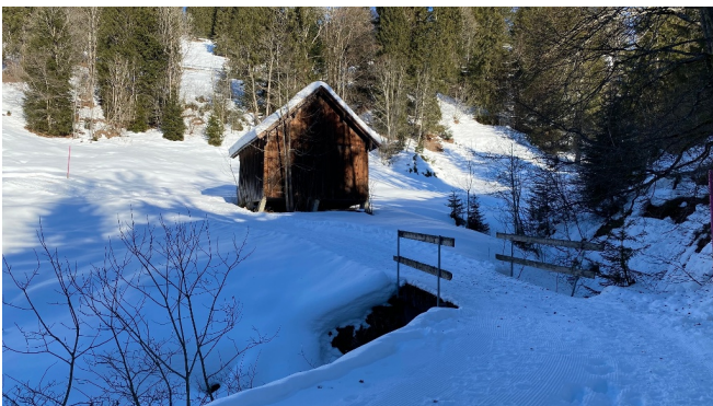
Rundweg Illgau - St. Karl