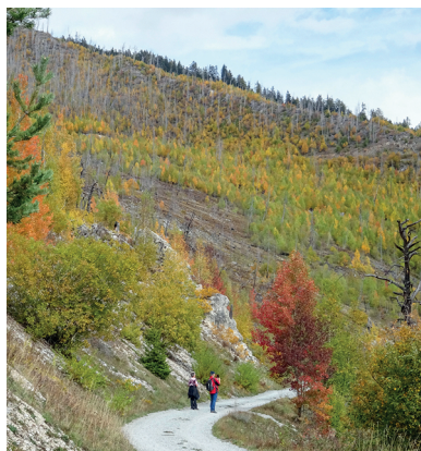
Beim Durchwandern wird einem das Ausmass der Waldbrandfläche besonders bewusst.