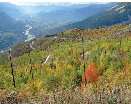
Die Stämme der verbrannten Bäume überragen auch nach 20 Jahren noch den Jungwald.