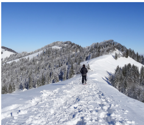
Gleich trennen sich die beiden Routen.