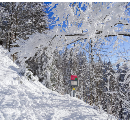
Zunächst geht es zwischen den Bäumen hindurch.