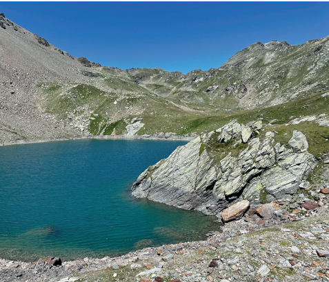
Der Sirwoltu Weiher, im Hintergrund der Sirwoltusattel.

Hotel Restaurant Rothorn Visperterminen, 027 946 30 23, www.hotel-rothorn.ch