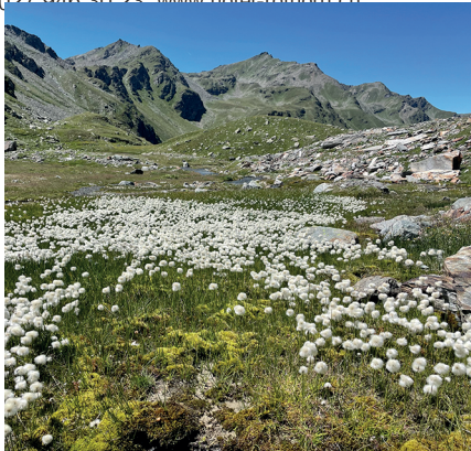
Auf dem Obers Fulmoos lässt es sich prächtig faulenzeln.