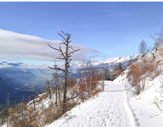
Noch heute zeugen verkohlte Bäume vom Waldbrand im Hitzesommer 2003.

Leukerbad Tourismus, 027 472 71 71, www.leukerbad.ch Restaurant Sunnublick Albinen, 027 473 13 87, www.sunnublick.ch