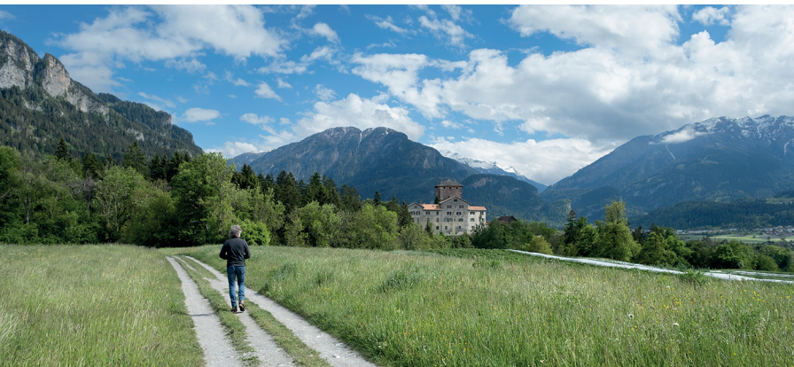
L'imponente castello di Rietberg: qui nel XVII secolo Pompejus von Planta trovò la morte per mano di Jörg Jenatsch.

Casa Caminada, Fürstenu, 081 632 30 50, www.casacaminada.com