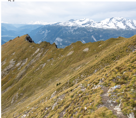
In der steilen Flanke, die zum Montalin hinaufführt.