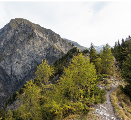
Blick vom Fürhörnli zum Montalin.

Restaurant Zur alten Post, Maladers, 081 252 67 53