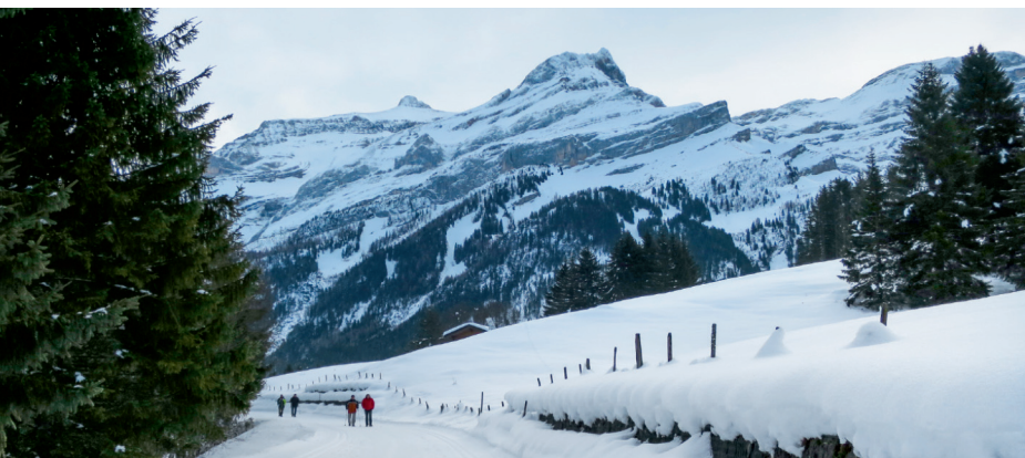
Der Scex Rouge dominiert das Panorama des Waadtländer Dorfs Les Diablerets.

Auberge de l'Ours, Vers-l'Eglise, 024 492 44 00, www.auberge-de-lours.ch Télé Diablerets, 024 492 28 14, www.diablerets.ch