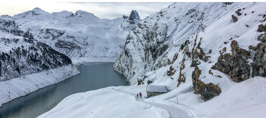
Die Aussicht auf Stausee und Zervreilahorn beeindruckt.

Fahrplan Zervreila-Shuttle: www.vals.ch oder www.zervreila.ch . Im Restaurant Zervreila können Schlitten gemietet werden. Bitte erkundigen Sie sich immer nach den Öffnungszeiten. 081 935 11 66