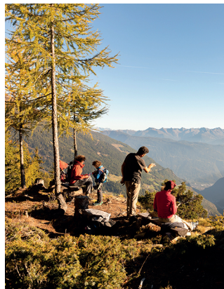
Am höchsten Punkt des Köhlerwegs belohnt der Blick Richtung Tirano.