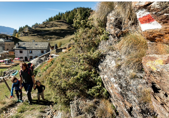
In San Romerio beginnt der Köhlerweg.

Alp San Romerio, 081 846 54 50, www.sanromerio.ch