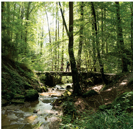
Auf verschlungenen Pfaden und über Brücken durchs Dorfbachtobel.