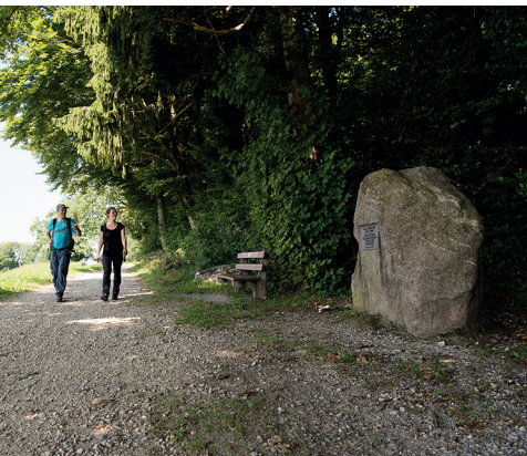
Am Pfannenstiel geht es vorbei am Gedenkstein für den Gründer der Wanderwege.

Restaurant Hochwacht, 044 984 02 55, www.hochwacht-pfannenstiel.ch Restaurant Vorderer Pfannenstiel, 044 923 55 44, www.restaurant-pfannenstiel.ch Wirtschaft zur Burg, Friedberg, 044 923 03 71, www.wirtschaftzurburg.ch