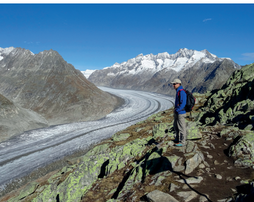
Der Aletschgletscher ist der längste Gletscher in der Schweiz.

Pro Natura Zentrum Aletsch, www.pronatura-aletsch.ch Restaurant Bettmerhorn, 027 928 41 91, www.aletscharena.ch Restaurant Riederfurka, 027 928 66 42, www.aletscharena.ch