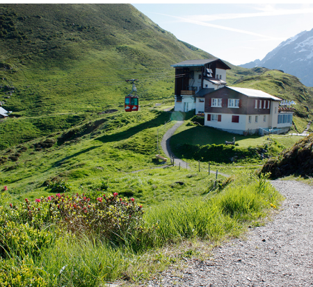
La station de téléphérique de la Füreinalpbahn est le point de départ de la randonnée.

Restaurant Alpenrösli, 041 637 44 24, www.alpenroesli-engelberg.ch