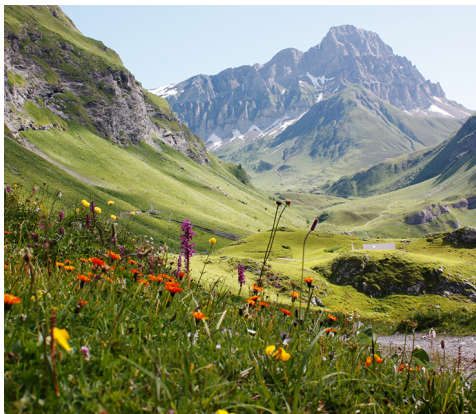
Cette vue se présente en direction de Surenen.