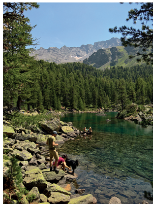
Au bord du lac de Saoseo.