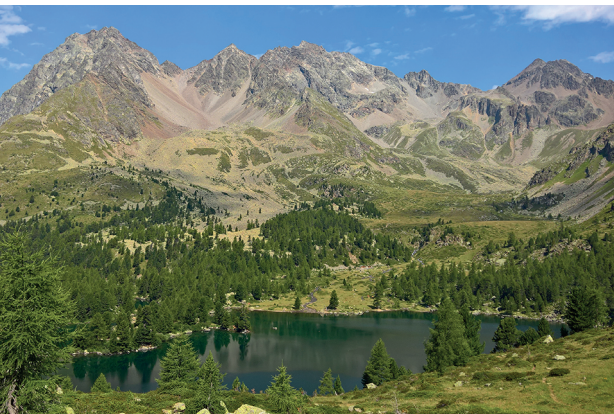
Un terrain de jeu idéal, surtout près de l'endroit où la rivière de montagne se jette dans le lac de Viola.

Ristorante Pensione Alpe Campo, 081 844 04 82/078 756 04 35