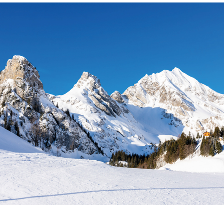
Les impressionnants sommets uranis.

On accède à l'arrêt Isenthal St. Jakob en car postal depuis la gare de Flüelen. De là, on monte à Gitschenen en téléphérique (départ toutes les demi-heures, www.skiliftgitschenen.ch ).