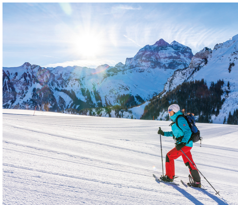
Ce circuit facile est idéal pour les enfants et les débutants.