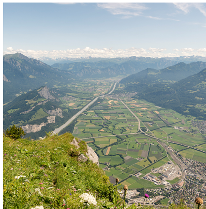
Vue imposante sur la vallée du Rhin depuis le Gonzen.