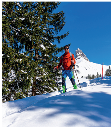
L'itinéraire traverse une forêt de sapins clairsemée.