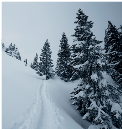
Le dernier passage avant le point culminant, Unter Nüen.