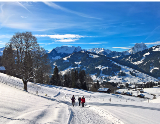
Vue panoramique lors de la descente vers Gruben, avec la Gummfluh sur la droite à l'arrière-plan.

Golfhotel Les Hauts de Gstaad, Saanenmöser, 033 748 68 68, www.golfhotel.ch Hotel Bernerhof, Gstaad, 033 748 88 44, www.bernerhof-gstaad.ch