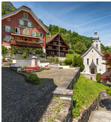
Après l'arrivée à Bauen, embarquement pour un final en apothéose.