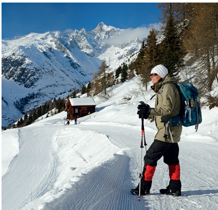
A hauteur de Mutti, le Kleines Wannenhorn apparaît.