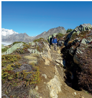
Des crevasses de plusieurs mètres de profondeur traversent le sous-sol à gauche et à droite du chemin.