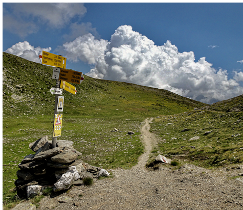
Au Col de Bistinen.