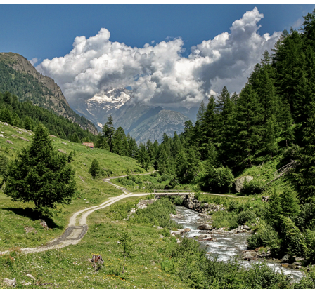
Franchissement de la rivière Gamsa, dans le Nanztal.

Heid Dorf Visperterminen Tourismus, 027 946 03 00, www.heid Dorf.ch Hospice du Simplon, 027 979 13 22, www.gsbernard.ch/simplon