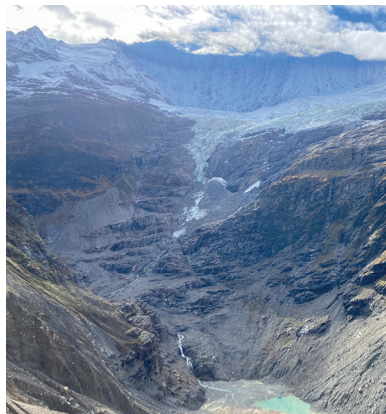
Les Fiescherhörner sont cachés dans les nuages. Le retrait du glacier se poursuit.