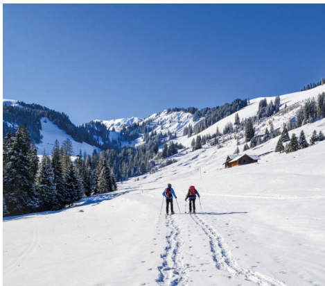
La route enneigée peu avant Schwändli. Au loin, le sommet du Niderhore.