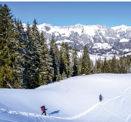
Descente dans la poudreuse en direction de Schönebode.