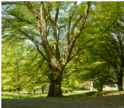
De vieux hêtres nouveaux invitent à flâner sur l'Allmend de Balzers.