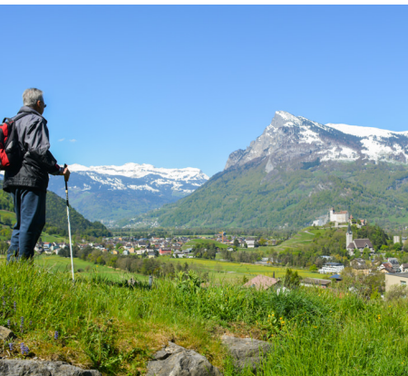
Surplombant la vallée du Rhin de 70 mètres, le château fort de Gutenberg attire l'attention des visiteurs.

Restaurant Alte Eiche, 00423 392 26 86, www.alteeiche.li Hôtel Garni Säga, 00423 392 43 77, www.saega.li