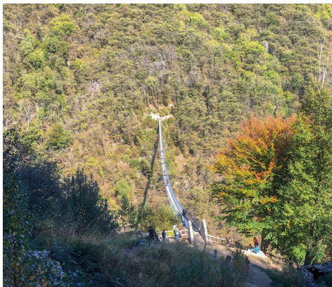
Tout à coup, les arbres se raréfient et permettent de découvrir le pont imposant.