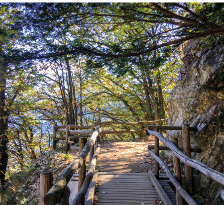
Un pont en bois peu avant le pont suspendu.

On atteint à Monte Carasso, Cuvénét en Bus depuis Bellinzona.