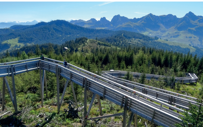
La passerelle Gägersteg traverse la surface dite de chablis, que l'on doit à l'ouragan Lothar.