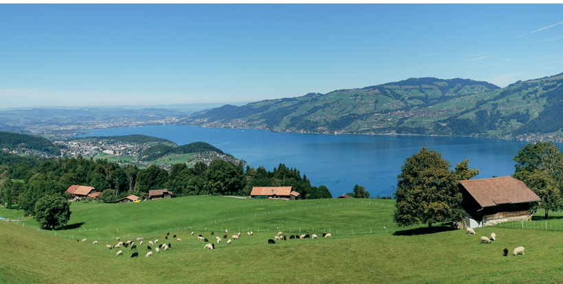
Ferdinand Hodler aurait volontiers posé son cheval ici.

Hotel Meielisalp, 033 847 13 41, www.meielisalp.ch