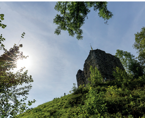
La partie encore debout de la tour d'habitation du château de Last.