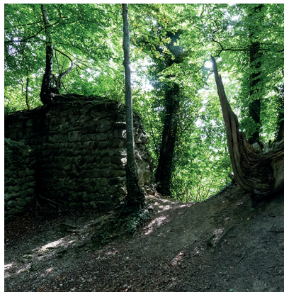
Plus que quelques vestiges de murs: les ruines de Heuberg.