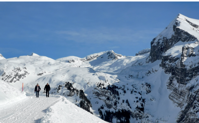
Dans la descente entre la cabane Brunni et Ristis, vue sur le Griessental; à droite, le Gross Gemsispil.