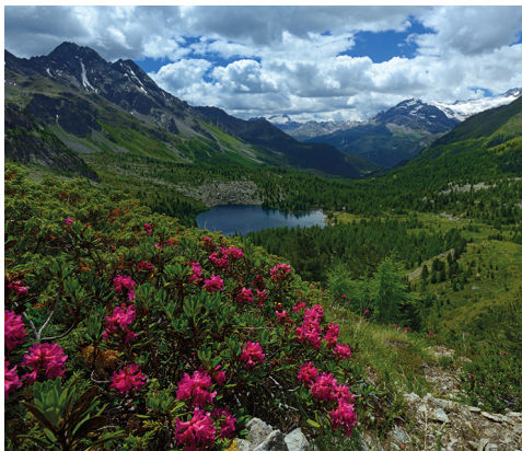
Tant de belles couleurs: vue enchantée sur le lac du Val Viola.