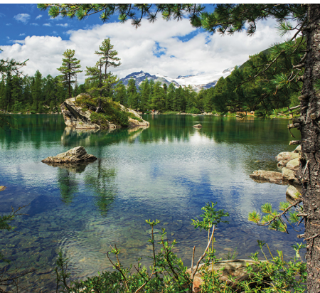
La randonnée de montagne dévoile immédiatement une de ses merveilles: le lac de Saoseo.