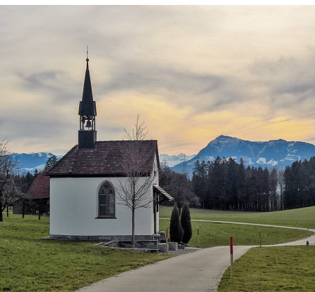
Derrière la chapelle, le Rigi semble proche.

On accède à Hildisrieden en bus depuis Lucerne ou Menziken (AG). Rothenburg, sur la même ligne, est aussi desservi par le RER Lucerne-Sursee.