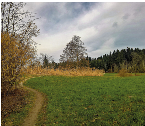
En hiver aussi, cette randonnée en plaine vaut la peine.